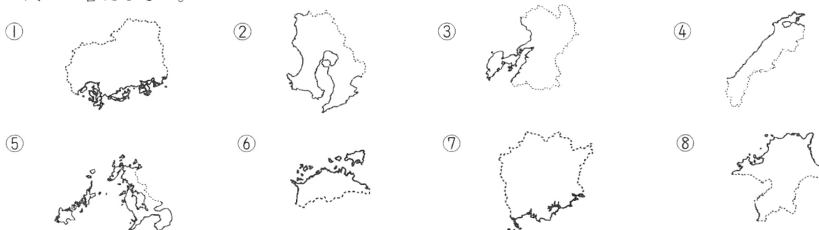
(上がほぼ北。縮尺は同じではない。—— は海岸線。----- は県境線。島は一部省略。)

1 次の①～⑧は、中国地方・四国地方・九州地方のいくつかの県の形を示しています。よく見て、後の問いに答えなさい。